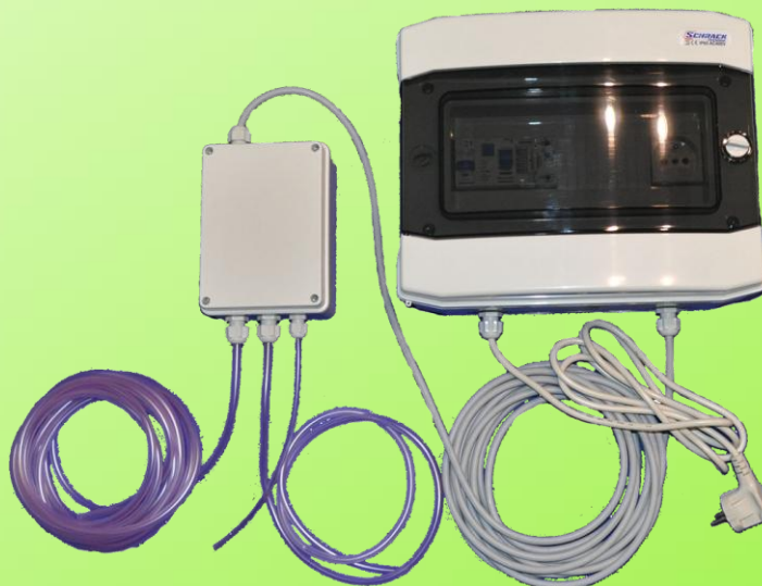
Pohled na sestavu automatika DČ 1