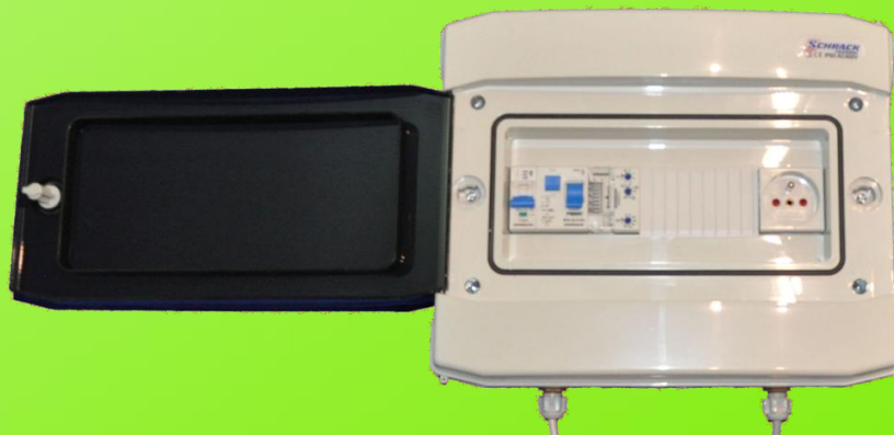
Pohled na vnitřní část rozvaděče

Automatika DČ 2 nahrazuje tablety 5v1, potažmo tablety Triplex.